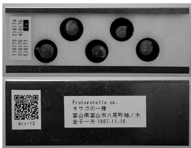
図3 ラベリングの例 (スライドは保存用)。

天板には市販の厚さ 1 mm 程度のスライドガラスを利用した。保存用のガラス素材は、劣化しにくく透明度が高いホウケイ酸ガラス (白ガラス) が望ましいが (Sturm, 2006; Callomon and Rosenberg, 2014), 白ガラスは高価であり、炭酸ソーダガラス (水ガラス) であっても劣