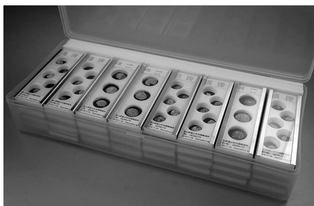
図4 収納例 (スライドは一時保管用)。市販の蓋つきポリエチレンケースに重ねて収納し、後部の余白はスライド作成時に端材となったポリスチレンボードで埋めた。

化生成物が炭酸塩を直接侵すわけではないため、一時保管用には水ガラスを用いた。なお、現在国内で流通している微化石スライドと同梱の天板も炭酸ソーダガラスである。