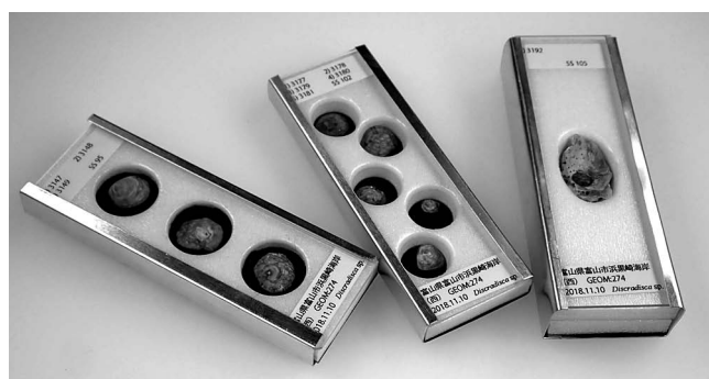
図1 作成した微小貝スライド（一時保管用）。左は3穴、中央は5穴でいずれもホール部の厚さ5 mm。右は1穴で厚さ10 mm。

富山市科学博物館（以下 当館）では近年寄贈された化石資料の中に1 cm未満の小型貝化石が含まれていたほか、筆者の調査活動の過程で必要に迫られたことなどもあり、微化石スライドを参考に、ミリメートルスケールの小型の貝類や化石が収められる保存ケースを自作した（図1）。個収納が基本であり、サイズも有孔虫などの微化石より一桁程度大きいものを対象とするため、本稿ではこれを「微小貝スライド」と呼んで区別する。同様の