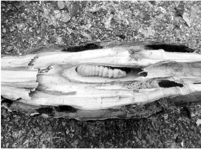
図3 富山県中央植物園のトチノキの剪定枝から発見されたカミキリムシ類の幼虫。

孵化後の幼虫は樹木の抵抗反応（樹液滲出）によって生育が阻害され、死亡率が高いとされている（Morewood et al. , 2004）。しかし、本調査では本種の加害が原因と考えると矛盾の無い樹勢の衰えや部分的な枯死が確認された。この要因は明らかとならなかったものの、一因には、モクゲンジが植栽された地点の土壌環境や植栽の条件が好ましくなかったため、幼虫に対する樹木の抵抗性を十分に発揮できなかった可能性が考えられる。