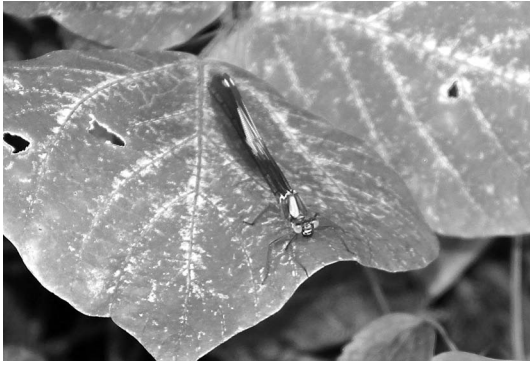
図1：ニホンカワトンボ未成熟 上市町野島 2022.10.15 。