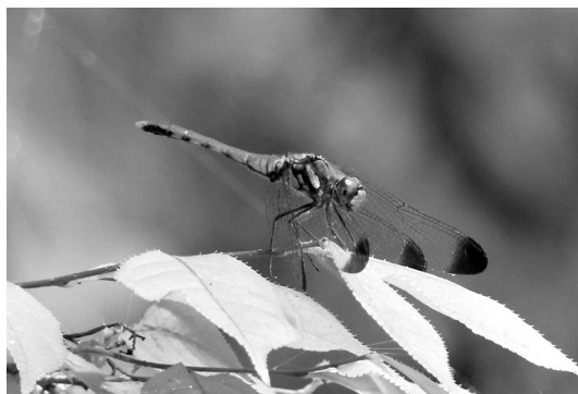
図14：リスアカネ♂胸部黒条発達 富山市(大沢野町)岩木新 2022.8.2.