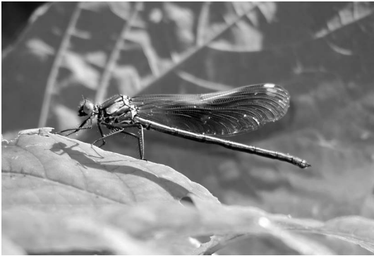
図2：ニホンカワトンボ未成熟 上市町野島 2022.10.28 。