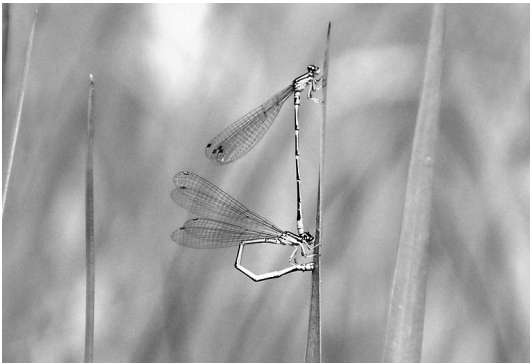
図3：オゼイトトンボ連結産卵 朝日町棚山 2022.6.12 。