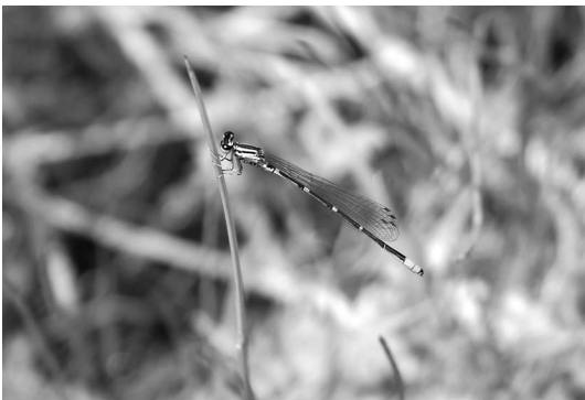
図4：オゼイトトンボ 朝日町山崎 2022.6.19 。